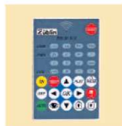
Art.-Nr. 25320 Siehe S.4