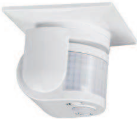
SG 3100 IR Montage auf Abdeckplatte an Wand oder Decke