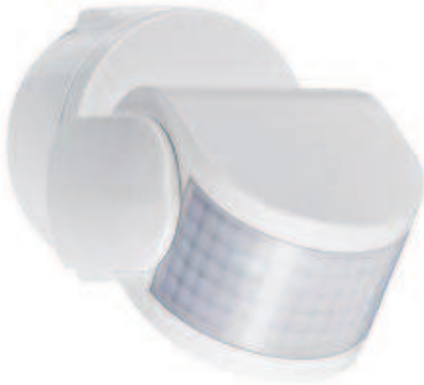
SG 3100 IR AP Montage an Wand oder Decke