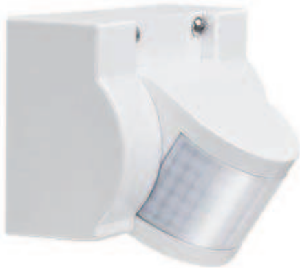
SG 2100 IR Wandmontage